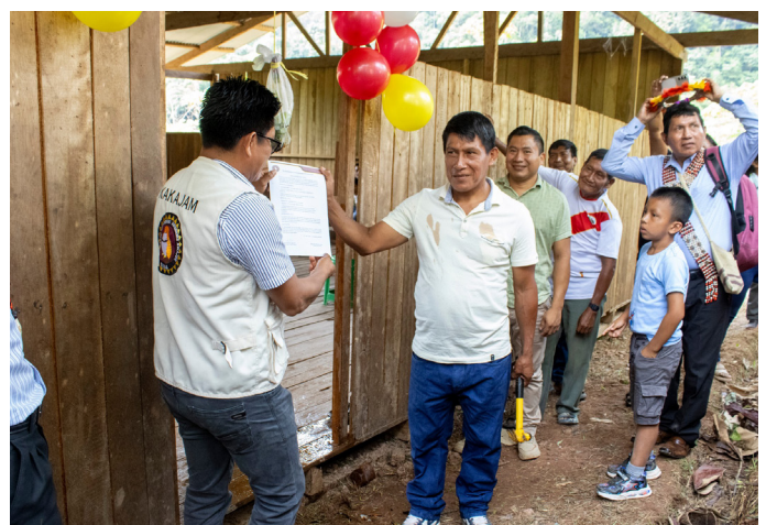
Entrega de oficina descentralizada en el sector Alto Comaina.

La asamblea en Alto Comaina demuestra que el autogobierno awajún se construye desde el territorio, con organización, vigilancia y decisiones colectivas frente a los desafíos que enfrenta nuestro pueblo.